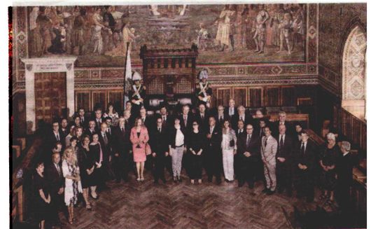
Il corpo diplomatico ricevuto a Palazzo Begni